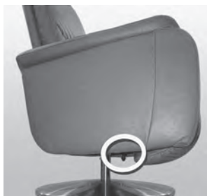
Ladestecker an der Unterseite vom Seitenteil

Der Ladevorgang ist nach ca. 8 Stunden abgeschlossen. Trennen sie nun das Netzteil vom Netz und lösen das Kabel vom Ladestecker!